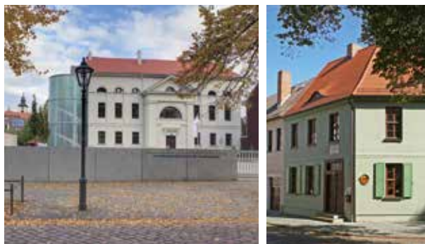
Die Homöopathie-Stiftung hat ihren Sitz in der Europäischen Bibliothek für Homöopathie. Der homöopathische Weltärzteverband hat seinen Sitz im Hahnemann-Haus.