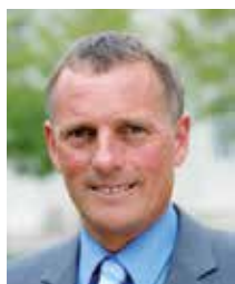
Kurt-Jürgen Zander war von 2001 bis 2015 Oberbürgermeister der Bach- und Homöopathie-Stadt Köthen