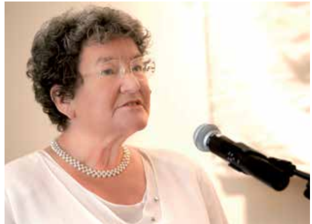
Prof. Dr.-Ing. habil. Dagmar Schipanski, die Schirmherrin der Homöopathie-Stiftung